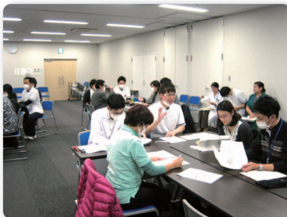
各グループ症例検討